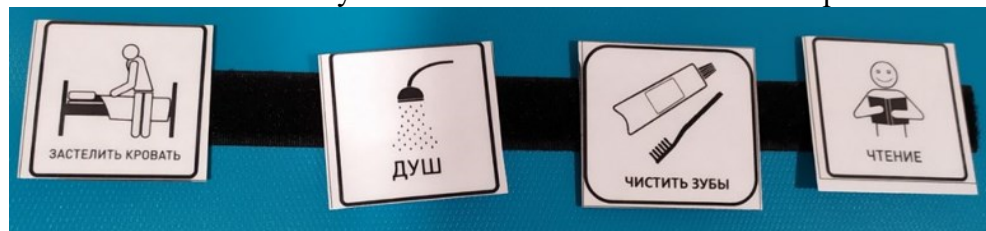
Рис.2 Расписание дня с карточкой «Чистить зубы»

• В течение дня обсуждать, что все чистят зубы, играть в чистку зубов куклам и игрушечным животным, читать книги о чистке зубов. Обсудить последствия отказа от чистки